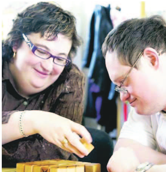
Les déficients mentaux victimes de cancers ont du mal à exprimer leurs souffrances.

« Derrière une apparente similitude entre personnes valides et déficients mentaux, on constate beaucoup de différences. Ainsi, les déficients présentent davantage de cancers digestifs, cérébraux, de tumeurs des testicules ou de la glande thyroïde... En revanche, on diagnostique moins de cancers du poumon et de la gorge, ce qui s'explique par le fait qu'ils boivent moins et pour la plupart, ne fument pas ; moins de cancer du col de l'utérus pour les femmes, car les rapports sexuels sont moins fréquents. » Mais comment découvrir la maladie, chez un déficient ?