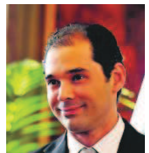
Tugan Sokhiev

« Le fait qu'un grand chef comme Tugan Sokhiev puisse demeurer pendant près de quinze ans à la tête de l'Orchestre du Capitole est la garantie que nous allons poursuivre notre dynamique, notre élan. Cet engagement est tout à fait exceptionnel. A un moment où